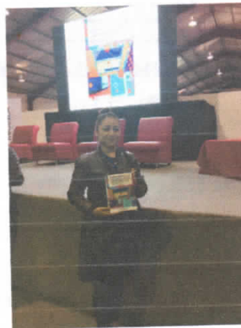
Fotografía 2. Presentación de libro